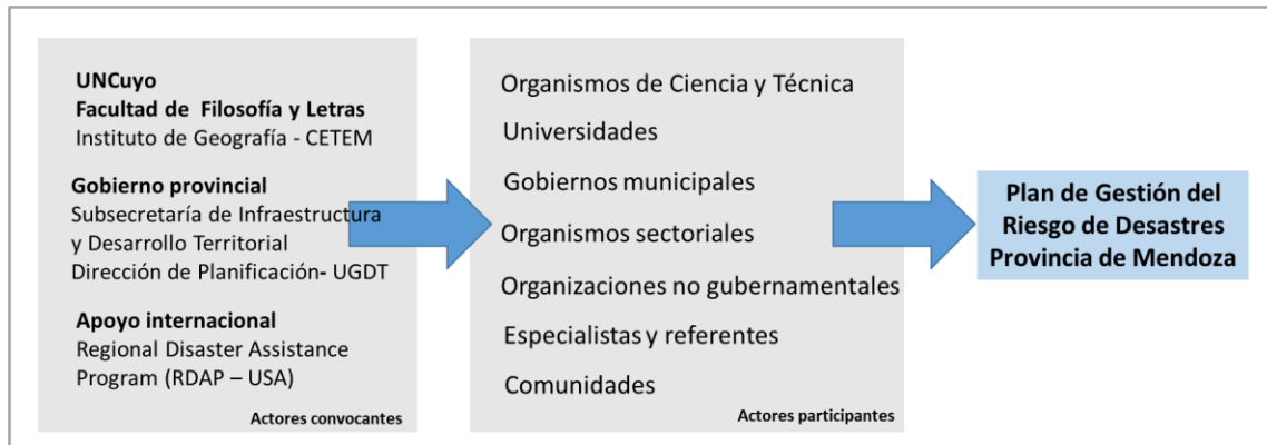
Figura 2: Actores participantes en el proceso de formulación del Plan de Gestión del Riesgo

Además del estudio del marco normativo, una de las principales contribuciones de este trabajo es brindar una pauta metodológica para que el Gobierno de la Provincia, junto a los municipios y demás instituciones gubernamentales y no gubernamentales realicen aportes que promuevan el surgimiento de un Plan Provincial de Gestión del Riesgo.